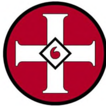
Рисунок 2. Кельтский крест. Символ многих расистских организаций