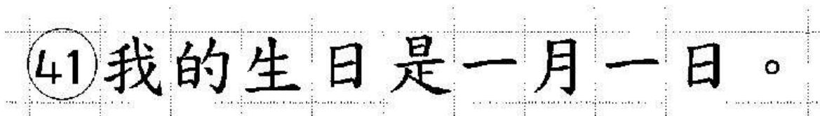
Рис. 22. Образец написания иероглифических знаков

Бланк ответов № 2 (лист 1 и лист 2) по китайскому языку (рис. 20, 21) предназначен для записи ответов на задания КИМ для проведения ЕГЭ с развернутым ответом по китайскому языку (строго в соответствии с требованиями инструкции к КИМ для проведения ЕГЭ и к отдельным заданиям КИМ для проведения ЕГЭ). Каждый иероглифический знак и каждый знак препинания следует писать внутри отдельной клетки в поле ответов бланка ответов № 2 (ДБО № 2) (рис. 24).